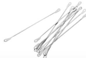
■ Couteaux à fromage