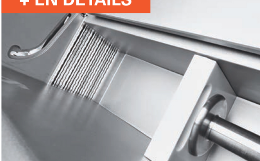
■ Pré-compression latérale, finement dosée