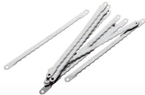
■ Lames ondulées