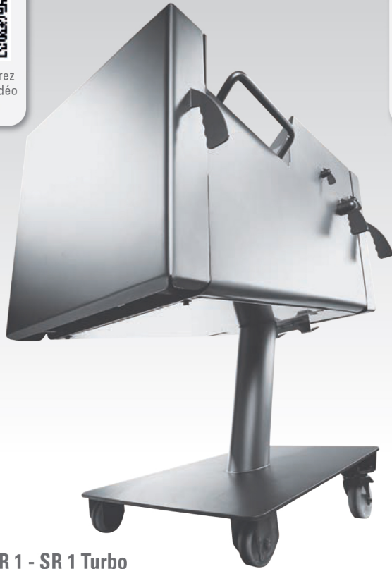
■ Cubeuse SR 1 - SR 1 Turbo