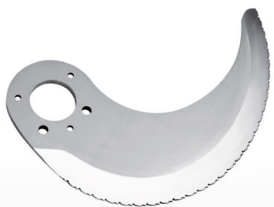
■ Couteau à découper les os