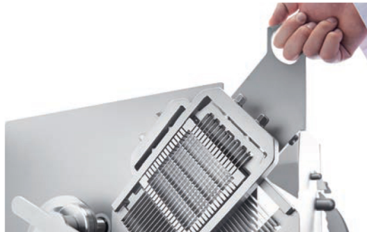
■ Changement de grille en 10 secondes