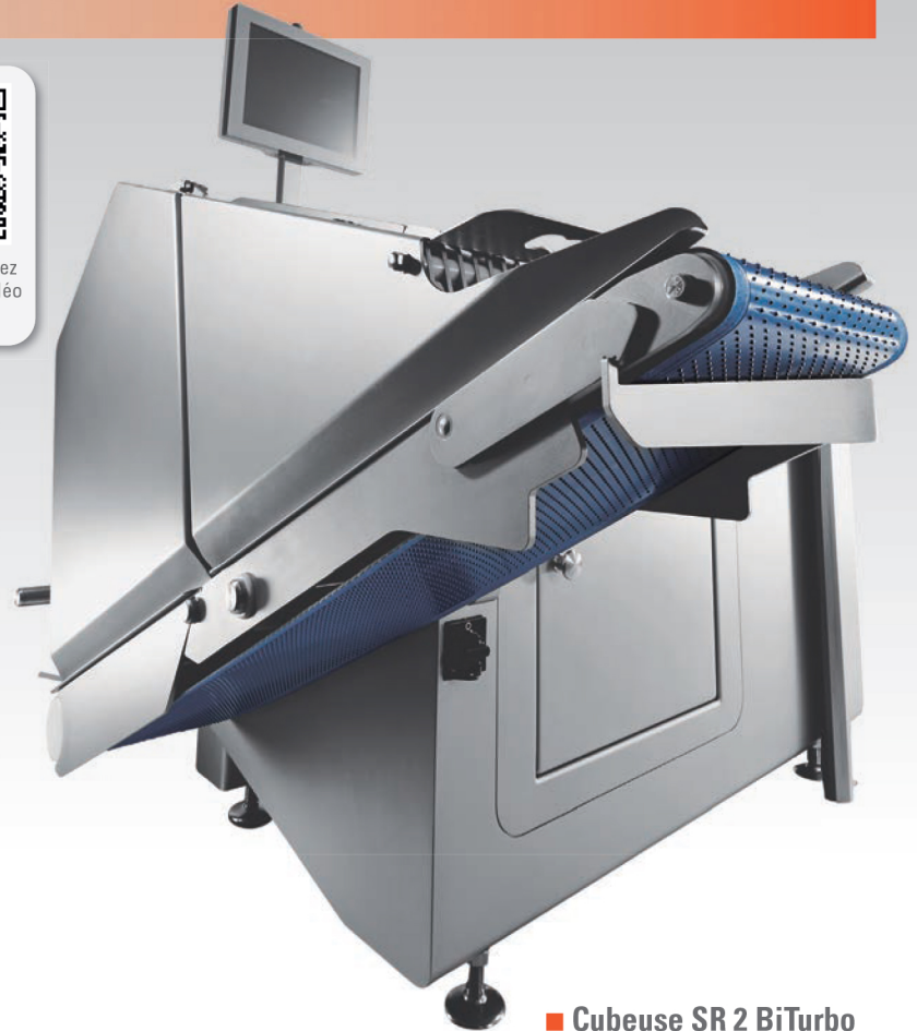
■ Cubeuse SR 2 BiTurbo