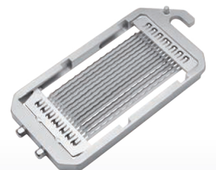
■ Niveau de grille SR 1