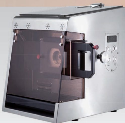
■ Hachoir réfrigéré vitrine DRC VR 82