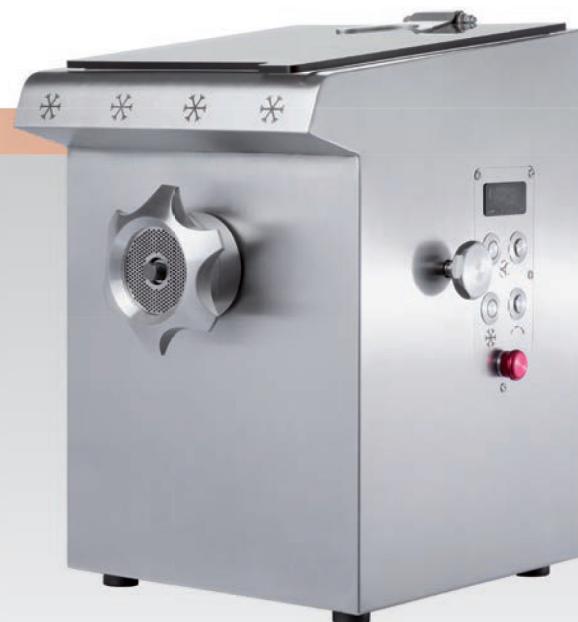
■ Hachoir réfrigéré DRC R 98 / DRC R 32