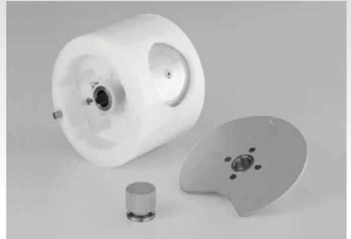
■ Formeuse à steaks Planus